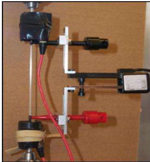
Figure 3 : Mèches, capteurs